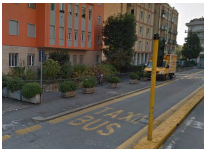
Brescia – Corsia riservata protetta da elementi in elevazione

6. Le corsie riservate, qualora non protette da elementi in elevazione sulla pavimentazione, sono separate dalle altre corsie di marcia mediante due strisce continue affiancate, una bianca di 12 cm di lunghezza ed una gialla di 30 cm, distanziate tra loro di 12 cm; la striscia gialla deve essere posta sul lato della corsia riservata (fig. II.427/a).