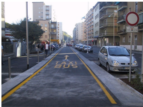
Brescia – Corsia riservata a bus, taxi e bici Ordinanza Prot. 38694/03 del 08/10/2003 (2003)