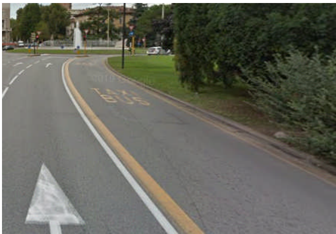
Brescia – Corsia riservata separata con strisce continue