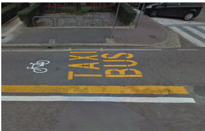
Brescia – Via Ducco – Corsia riservata a bus, taxi e bici

Tuttavia, si ritiene che in questo decreto non sia applicata in modo adeguato la definizione di corsia riservata, come da Codice della strada, che non esclude la possibilità che vi possano circolare più categorie di veicoli. Detto ciò, è giusto anche ricordare che le norme di tale D.M. sono prescrittive solo per le nuove strade. Di conseguenza, la scelta di condividere le corsie bus con velocipedi non contrasta con tale DM.