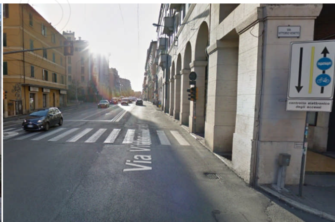
Bologna – Corsia riservata a bus e bici Ordinanza Prot. 178108/2007 del 27/07/2007