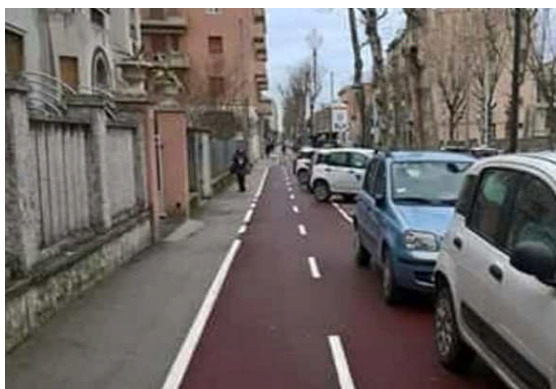
Comune di Ancona

Lo studio ministeriale del 2014 per la revisione del DM 557/99 <Istruzioni tecniche per la progettazione delle reti ciclabili>, in sintesi "Schema IT", stava fornendo indicazioni utili per la risoluzione di diversi aspetti progettuali.